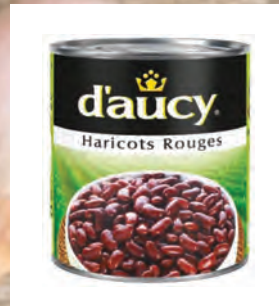
ČERVENÉ FAZOLE VE VLASTNÍ ŠTÁVĚ Baleno – 12 × 425 g