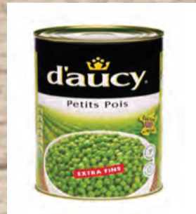
HRÁŠEK VELMI JEMNÝ Baleno – 12 × 425 g