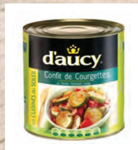
CUKETOVÉ CONFIT Baleno – 3 × 2,5 kg