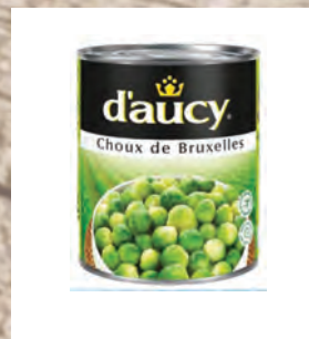
KAPUSTA RŮŽIČKOVÁ Baleno – 12 × 1 kg