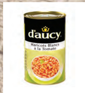
BÍLÉ FAZOLE V TOMATĚ Baleno – 3 × 4 kg