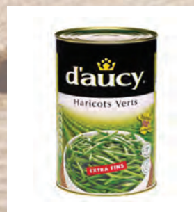
ZELENÉ FAZOLOVÉ LUSKY EXTRA JEMNÉ Baleno – 3 × 4 kg