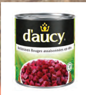
ŘEPA KOSTKY Baleno – 12 × 425 g