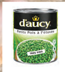
HRÁŠEK JEMNÝ Baleno – 3 × 2,5 kg