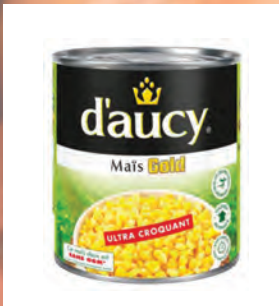
KUKUŘICE GOLD Baleno – 12 × 425 g