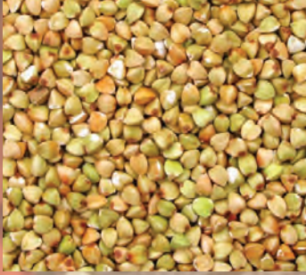
POHANKA Baleno – 5 kg