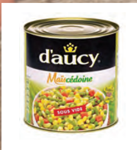
SMĚS S KUKUŘICÍ MAISCEDOINE Baleno – 3 × 2,5 kg