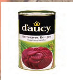
ŘEPA KOSTKY / PLÁTKY / NUDLIČKY Baleno – 3 × 4 kg