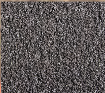
MÁK MLETÝ Baleno – 1 kg