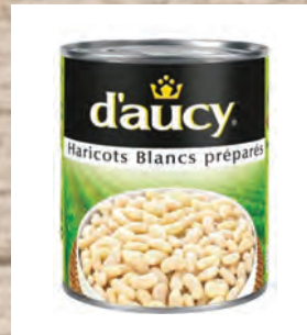
BÍLÉ FAZOLE Baleno – 12 × 425 g