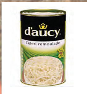
CELER STROUHANÝ Baleno – 3 × 4 kg