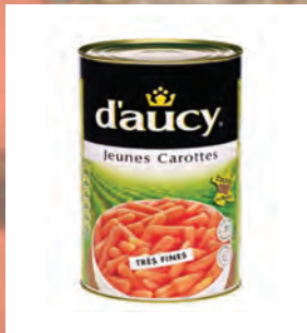
MRKEV BABY Baleno – 3 × 4 kg