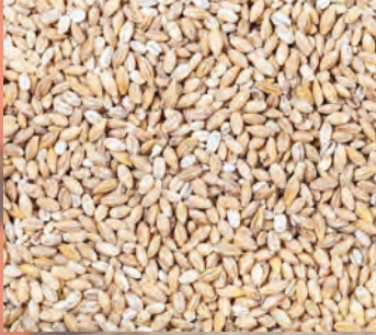
KROUPY Baleno – 4 × 500 g