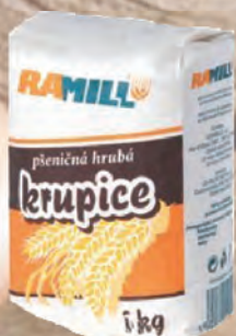
KRUPICE PŠENIČNÁ – JEMNÁ / HRUBÁ Baleno – 30 × 500 g