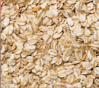
OVESNÉ VLOČKY Baleno – 4 × 500 g