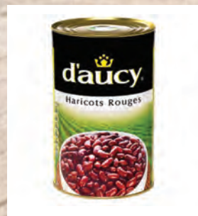
ČERVENÉ FAZOLE Baleno – 3 × 4 kg