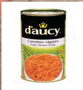
MRKEV STROUHANÁ 3 × 4 kg