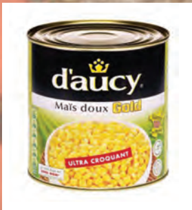
KUKUŘICE Baleno – 3 × 1,9 kg