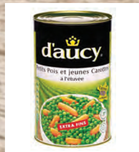
HRÁŠEK EXTRA JEMNÝ S BABY MRKVI Baleno – 3 × 4 kg