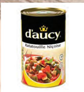
RATATOUILLE Baleno – 3 × 3,75 kg