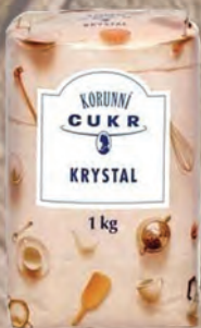
CUKR – KRYSTAL / MOUČKA Baleno – 10 × 1 kg