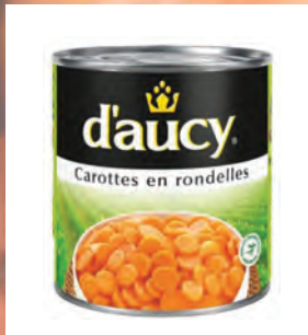
MRKEV KOLEČKA Baleno – 12 × 425 g