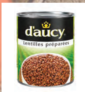
ČOČKA VAŘENÁ Baleno – 12 × 425 g