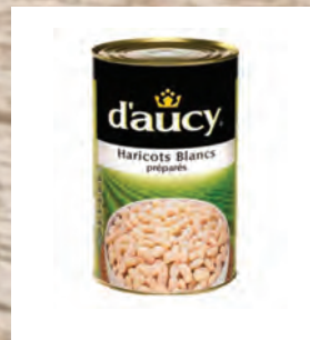
BÍLÉ FAZOLE Baleno – 3 × 4 kg