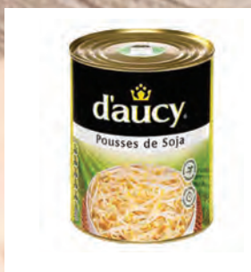
SOJOVÉ KLÍČKY Baleno – 3 × 2,5 kg